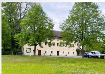
An der Bleiche