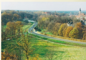
Blick vom Ehrenmal