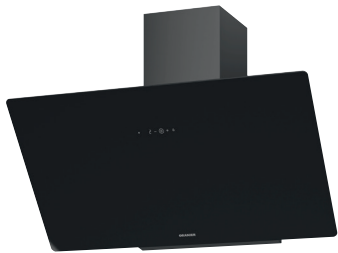
Lea 90 S